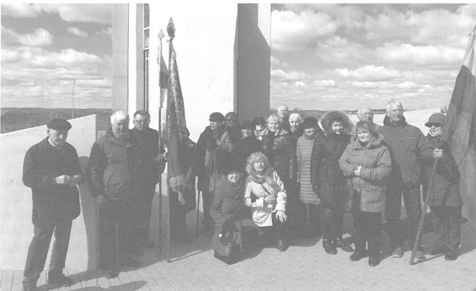
LPKTS Panevėžio filialo nariai Kryžkalnyje