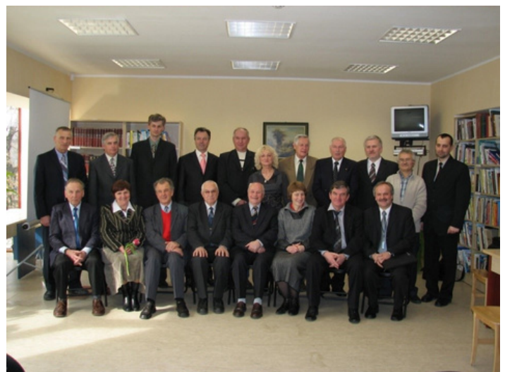
Varėnos krašto mokslininkų konferencijos dalyviai. 2007.