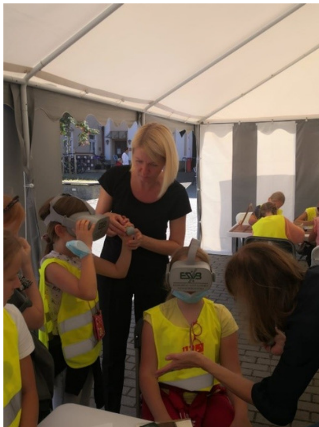
Pristatymas „Skaitymo festivalyje“ VAVB. 2021.

Per prabėgusius tūkstantmečius Elektrėnų krašte, kaip ir visoje Lietuvos teritorijoje, gyvenę žmonės paliko daug ir įvairių archeologijos paveldo objektų: senųjų gyvenviečių, laidojimo, gynybinių, gamybos, kulto ir kitokių vietų. Žinodami ir mokėdami jas atpažinti, mes atrandame ir įvardijame savo tapatybę ir savastį.