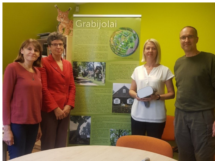
Pristatymas Neris regioninio parko direkcijoje. 2021.