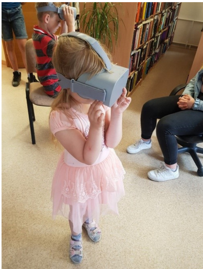
Vaikai išbando projekto virtualios realybės akinius. 2021.