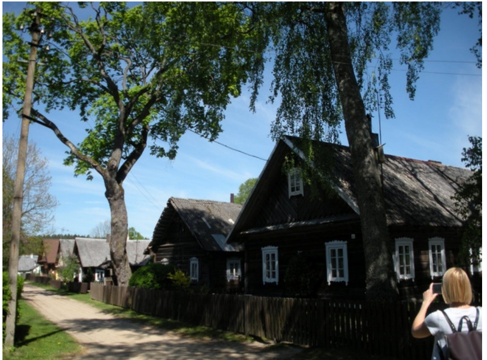
Grabijolų kaime. 2018.

Įamžinti etnografinį kaimą, kuris laikui bėgant vis labiau sensta, amžinybėn išeina ten gyvenantys žmonės – buvo viena iš priežasčių, paskatinusių mus sukurti virtualų turą po Grabijolų kaimą ir Grabijolų pažintinį taką. Norėjosi pasinaudojant šiuolaikinėmis technologijomis supažindinti vaikus, jaunus žmones su tuo ir paskatinti domėtis krašto paveldu, skleisti apie jį žinią, saugoti bei perduoti ateities kartoms.